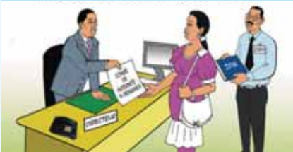
Tere gu mën a ànd ak ay daan, dàq gu lalu ci ëmb mbaa am doom di noppalu