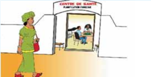
Fexe ba jàppandal jomtukaayi paj mi, yemale ci góor ak jigeen