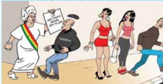
Kuu woo kuu be musoo bondi la dinkiraa, ka a sanba dindiraa doo to diiyaa- kuyaa la, ka a kuolu bula, anirƷ fanarƷ ka musoo balajaatoo waafi, ka buluu a la, wolu bee se buruka

Bankoolu minnu denta ñirƷ kanberƷ laahidoo la ye sila betoolu bee muta, kataa luwaa doolu, ferƷ woo ferƷ, wararƷ kuu woo kuu miŋ naata ka musoolu waafi anirƷ ka i farƷ waafi, ka i kuolu buruka, i ye bo kuolu bee to.