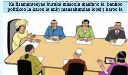
Ka fisamanteeyaa buruka musoolu maafarƷo la, bankoo politikoo la karoo la anirƷ mansakundaa loosirƷ karoo la