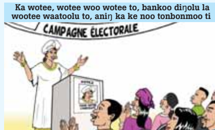
Ka wotee, wotee woo wotee to, bankoo dirƷolu la wotee waatoolu to, anirƷ ka ke noo tonbonmoo ti

a) Ka toloroo ke toloori dulaa woo toloori dulaa, anirƷ fanarƷ, i se ke toloomoolu ti fannaalu to, nirƷ i lafita ;